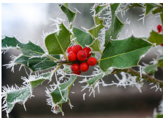
Hulst met ijskristallen in de vorm van naalden

Na een kristalheldere nacht met temperaturen onder het vriespunt, zie je vaak een sprookjesachtig wit laagje op gras, struiken, bomen, de tuintafel. Als de temperatuur van een voorwerp onder nul komt, verandert de waterdamp op het oppervlak van dat voorwerp in ijskristallen, dit noemen we rijp. Rijp kun je tegenkomen in de vorm van naalden, schubben, waaiers, veren of als een poeder- of suikerlaagje. Als je goed kijkt zie je prachtige details. Maak er snel een foto van, want zodra de temperatuur stijgt smelten de ijskoude kunstwerkjes.