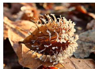
Napje van beukennotjes met ijskristallen als suiker