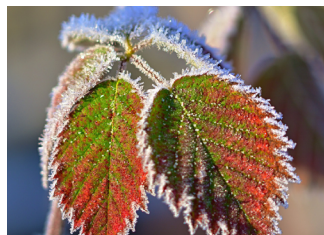
Blaadjes met een 'suikerrandje' van ijskristallen