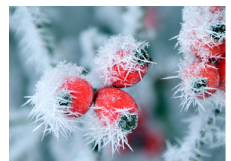
Rozenbottels met ijsnaalden