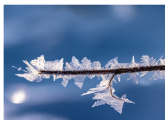
Takje met ijsveren